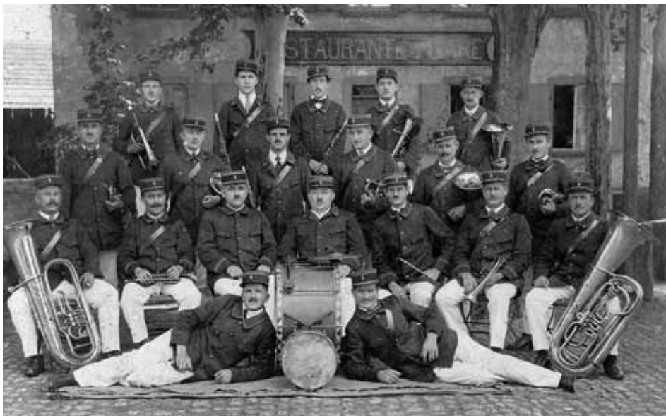
L'Association Musicale de La Wantzenau, dans les années 1930