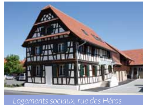
Logements sociaux, rue des Héros

la Mission Locale. Ce service public, spécialisé dans l'accompagnement vers l'emploi et la qualification des jeunes, assure maintenant trois permanences mensuelles sur notre commune. Des réunions de travail mensuelles sont mises en place à la mairie pour rechercher ensemble des réponses à des situations individuelles.