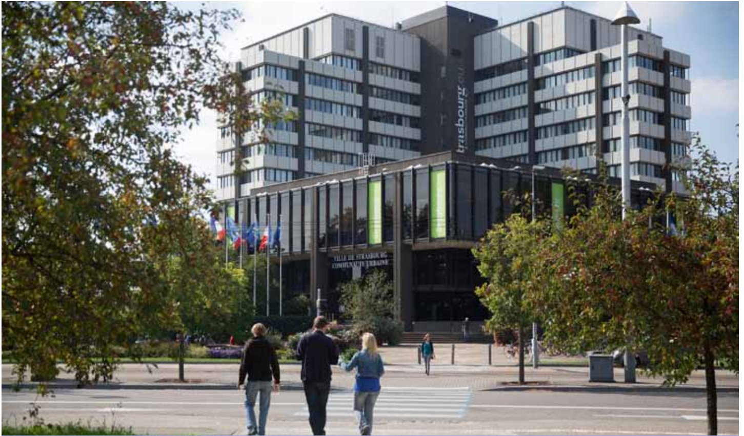
Siège de Strasbourg Eurométropole

En mars dernier, vous avez choisi une nouvelle équipe municipale, mais vous avez également désigné votre représentant à la Communauté Urbaine de Strasbourg devenue en janvier Strasbourg Eurométropole.