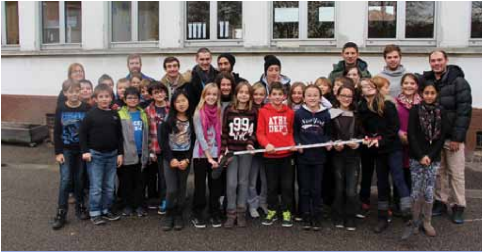
Photo de groupe des CM2 de l'Ecole III et Ried avec les hockeyeurs de l'Etoile Noire.

Les élèves de la classe de CM2 de l'Ecole III et Ried ont rencontré à plusieurs reprises les hockeyeurs de l'Etoile Noire.