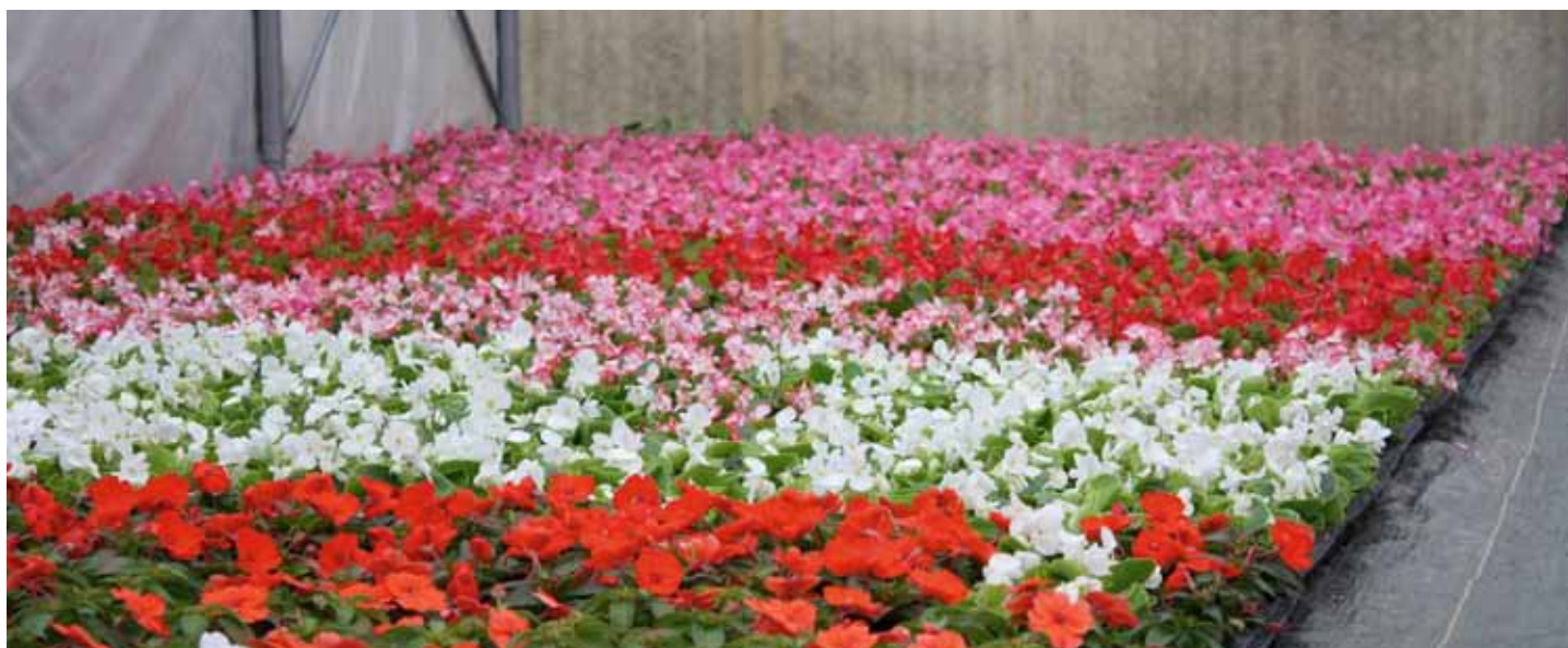
La serre communale où auront lieu, entre autre, les ateliers de jardinage.

« Il pousse dans un jardin plus de choses que l'on y a semé »