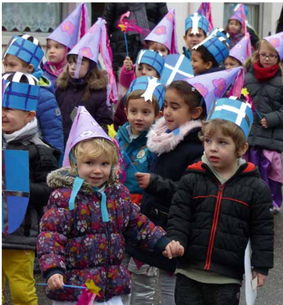
Princesses et chevaliers ont fièrement défilés lors carnaval dans le quartier (05/02/16)