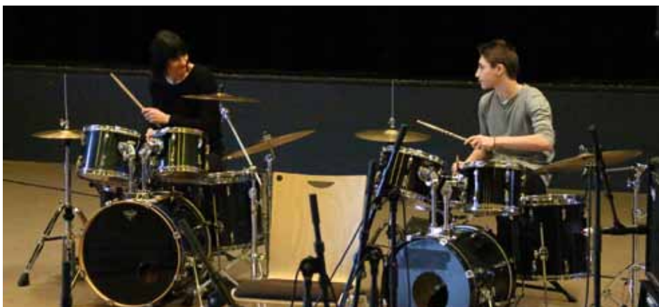
Le duo mère/fils de la famille Busy à la batterie lors du Concert des Familles (31/01/16)

En rendant au Fil d'Eau sa complète destination, nous faisons clairement le choix d'un pari gagnant sur le plan humain, social et économique. Ce lieu manquait considérablement d'investissement et de sens depuis sa création, nous avons maintenant une formidable occasion de le valoriser à son maximum et de le faire vivre dans toutes ses fonctions.