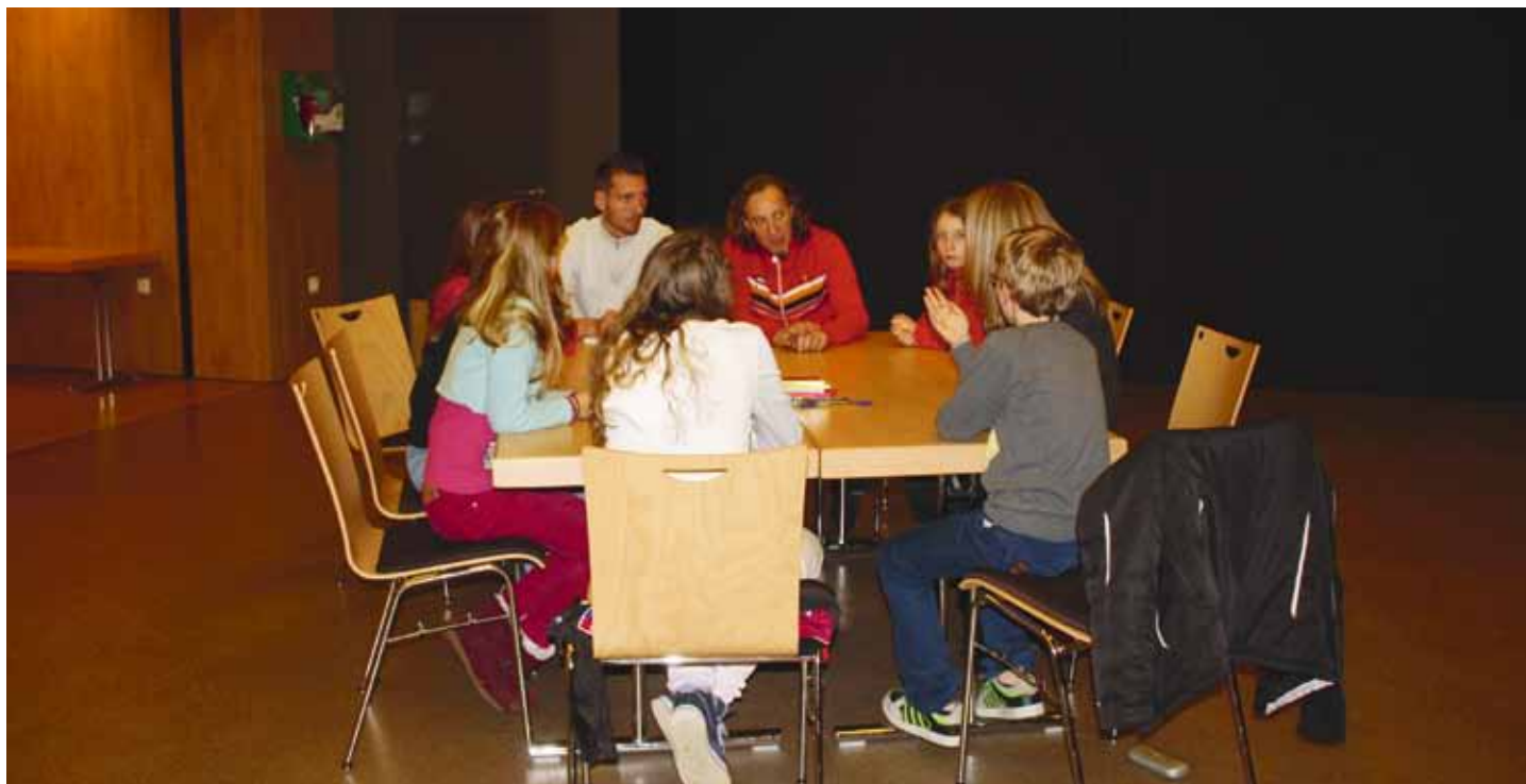
Assises de la jeunesse, « Notre jeunesse... quel avenir ? », les 17, 21 et 24 novembre 2014

En vue de redéfinir la politique jeunesse sur le territoire, la Municipalité a souhaité consulter les habitants sur la question de la jeunesse lors de rendez-vous participatifs.