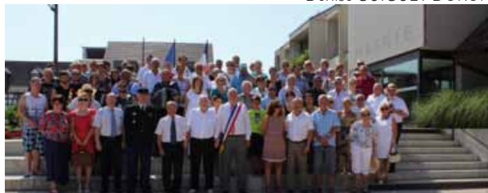
Photo de groupe (05/07)