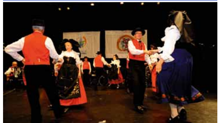
Groupe folklorique d'Hoenheim(04/07)