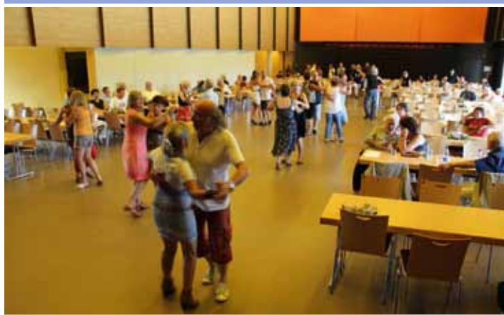
Thé dansant (05/07)