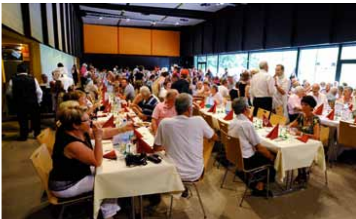
Soirée de Gala au Fil d'Eau (04/07)