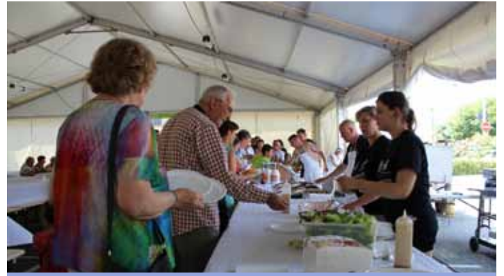
Grand barbecue géant (05/07)