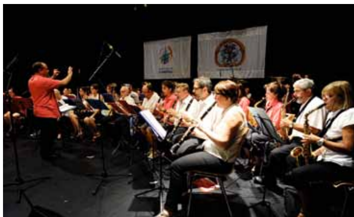
Concert de l'Union Musicale et de l'Harmonie Municipale (04/07)