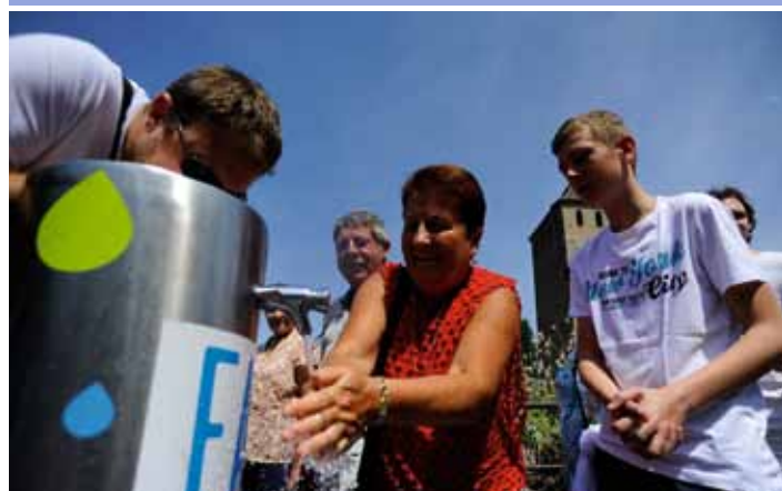
Rien de tel que de l'eau par cette chaleur ! (04/07)