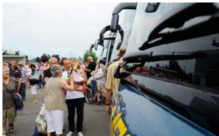
Retrouvailles à l'Espace Jean-Claude Klein (03/07)

LE maître mot de M. Kunkler revenait sans cesse : « satisfaire les Wantzenauviens, hébergeants, et les arédiens, hébergés » et puis « je m'adapte volontiers à leurs souhaits ».