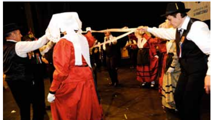
Groupe folklorique Lous Boueradours (04/07)