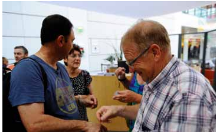
Visite du Musée d'Art Moderne de Strasbourg (04/07)