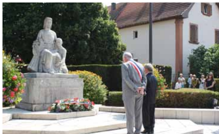
Dépôt de gerbe au Monuments aux Morts (05/07)

Une rencontre jumelage ne se conçoit que par l'implication de tous au sein de nos communes. L'impulsion provient certes des édiles mais la pérennité et la vitalité des échanges reviennent à leurs habitants.