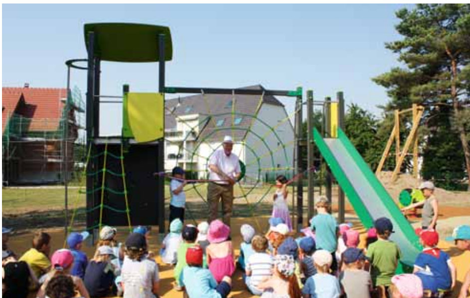
Inauguration de l'aire de jeux derrière la mairie en présence d'élèves de l'école du Centre