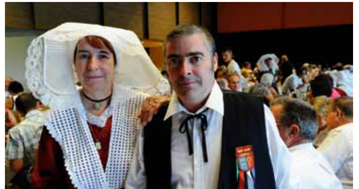
Couple arédien en costume traditionnel (04/07)

Une DJ pourra se produire, tout comme un orchestre de variétés à l'occasion du thé dansant. Bravo à eux !