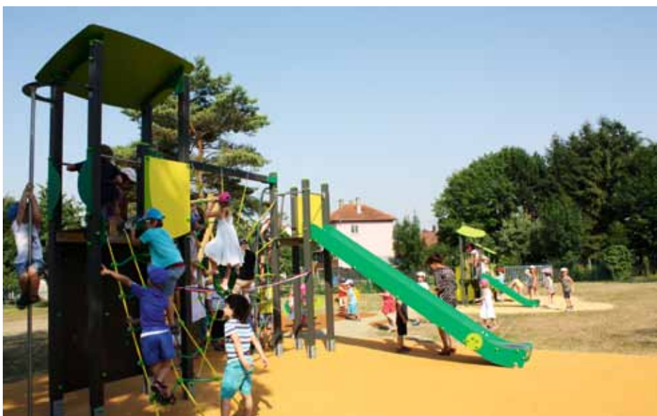
Après le coupé de ruban, place à l'amusement !