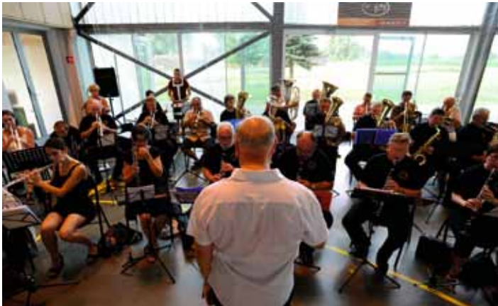
Accueil des Arédiens en musique par l'Harmonie Municipale (03/07)