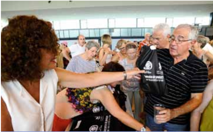
Remise d'un sac de bienvenue (03/07)