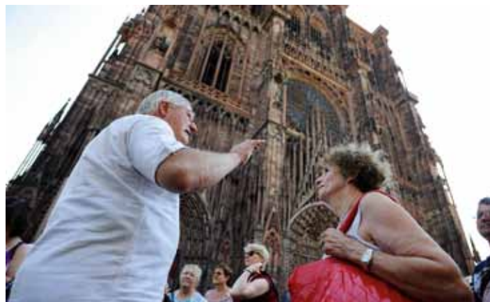
Visite du Strasbourg Insolite (04/07)