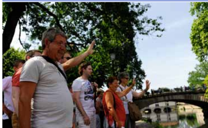
Les Haut-Viennois (re)découvrent Strasbourg (04/07)