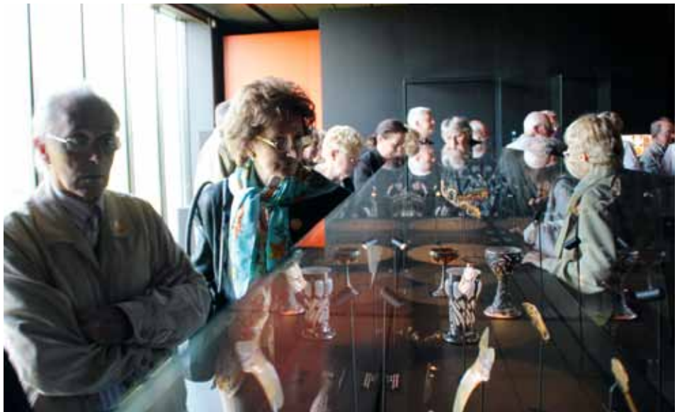
Visite guidée du Musée Lalique