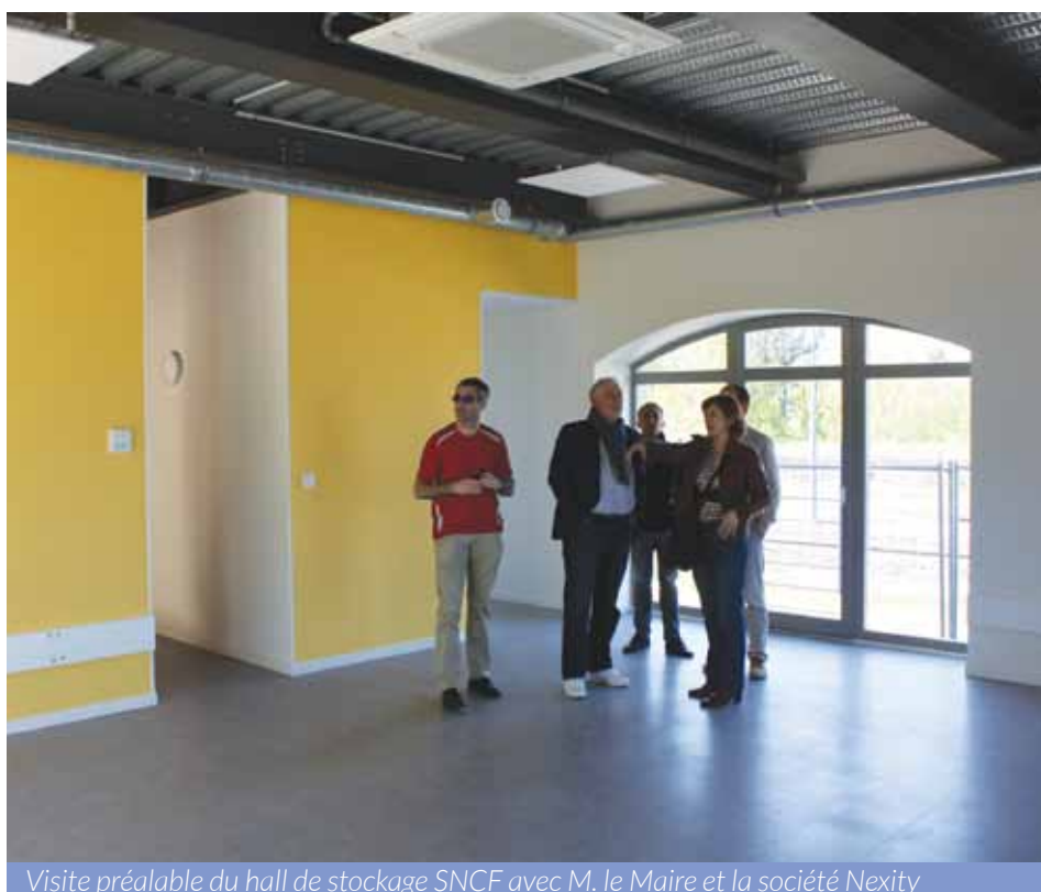
Visite préalable du hall de stockage SNCF avec M. le Maire et la société Nexity

M. le Maire a pu participer le 20 avril dernier à la visite préalable à la réception des travaux de l'annexe de stockage SNCF. Un effort particulier a été entrepris pour mettre en valeur le passé du bâtiment tout en offrant des prestations d'aménagement de qualité.