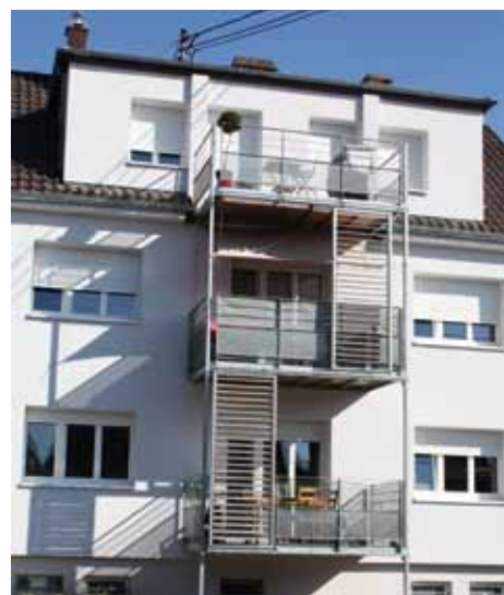
Logements aidés, 2, rue des Pinsons