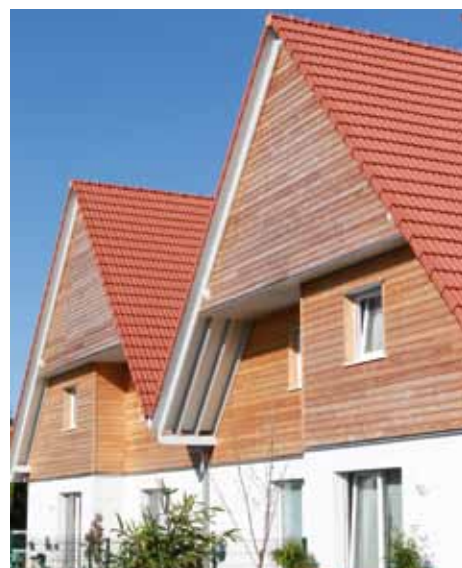
Logements aidés, rue Rochechouart