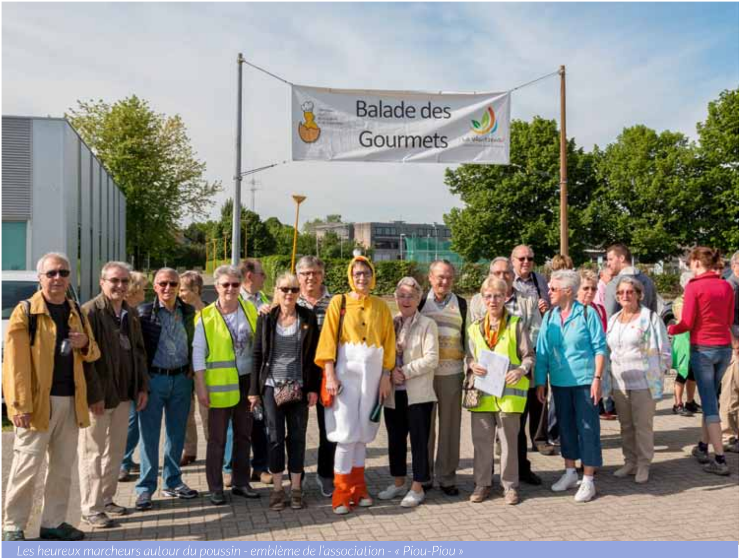
Les heureux marcheurs autour du poussin - emblème de l'association - « Piou-Piou »

Fin mars, l'association du poussin lance les inscriptions de la deuxième Balade des Gourmets et affiche complet en moins de sept heures. Pas de pré-inscriptions possibles et près de mille personnes restant sur leur faim.