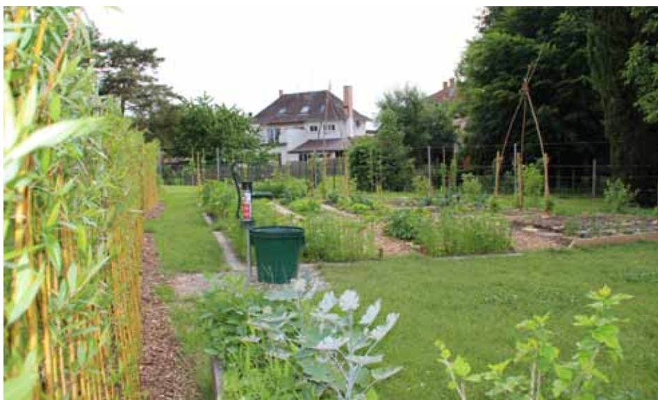
Ca pousse dans le jardin partagé !