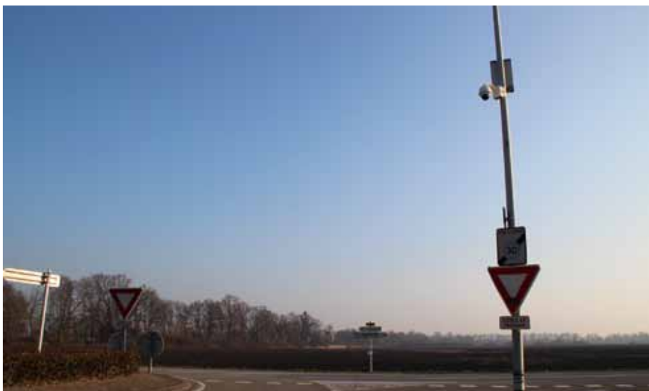
Première caméra, provisoire, à l'entrée du Domaine du Golf

On peut être pour ou contre la présence de caméras dans les villes. Certains pensent que cela peut renforcer la sécurité, d'autres qu'il s'agit d'une atteinte aux libertés individuelles.