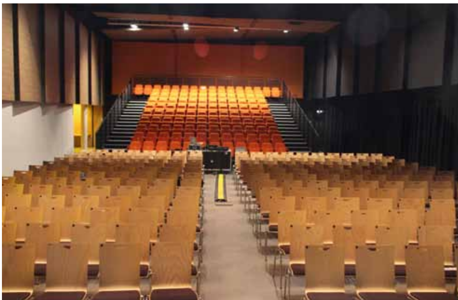
L'Espace Culturel et de loisirs Le Fil d'Eau accueille de nombreuses manifestations en diverses configurations.

Retrouvez le règlement complet et l'ensemble des tarifs, dans la rubrique « Culture, sports et loisirs » sur notre site Internet : www.la-wantzenau.fr