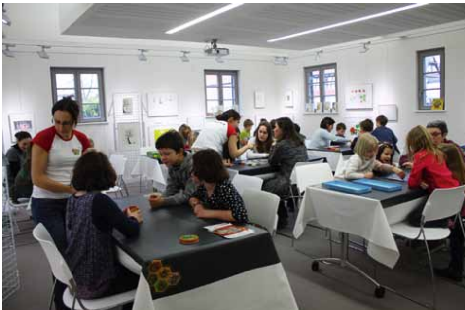
La salle d'animation de la bibliothèque était comble lors de cette première après-midi jeux de société.

Place aux standards, tels les incontournables « catane » et « dixit », aux nouveautés 2015 comme « loony quest », « splendor » ou aux jeux primés tel « takénoko ». Egalement des jeux familiaux : « zack & pack », « pique plume », « spalsh attack », « pyramide d'animaux », « clac-clac », « échelles et serpents » et « cap sur habanabi », qui ont séduit grands et petits. Pour les jeux de cartes « bataflash », « piou-piou » et « dooble ». Beaucoup d'autres sont restés dans leurs boîtes faute de temps mais pas d'envie... et si la liste ne vous dit rien, nous vous donnons rendez-vous aux prochaines vacances.