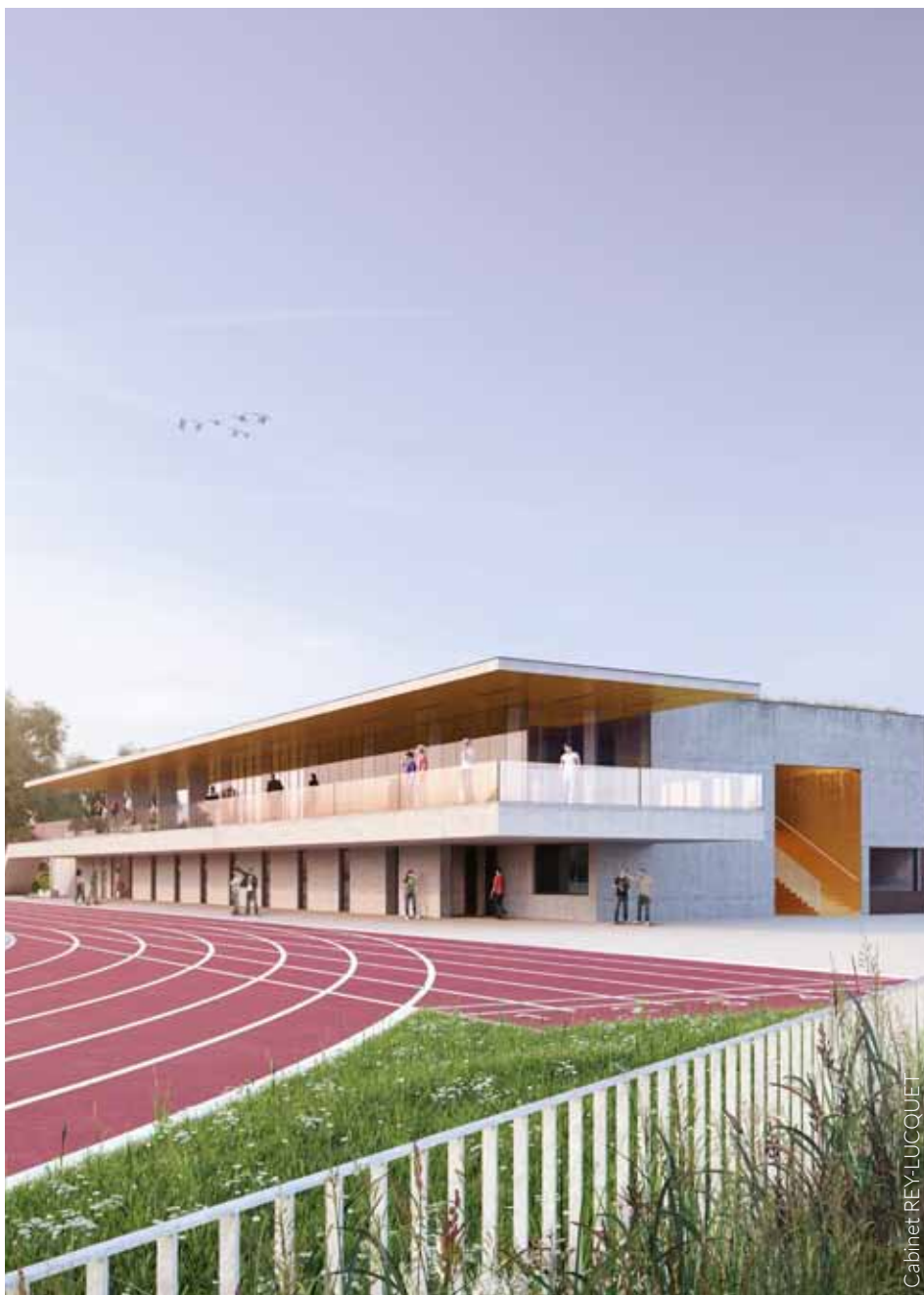
Projet et esquisse du futur club-house et des vestiaires du stade.

L'opération, évaluée à 1 850 000 euros HT, comprend par conséquent la construction en rez-de-chaussée de vestiaires (820 m 2 ) composés de locaux arbitres, de locaux joueurs et locaux divers (infirmerie, rangements). A l'étage, on retrouve un club-house destiné aux clubs de football et d'athlétisme, comprenant des locaux communs mais aussi des espaces propres à chaque association (380 m 2 ). L'enveloppe inclut également la création de locaux techniques, de sanitaires extérieurs, d'un espace de vente des billets et d'une buvette extérieure qui sera mise à disposition de nos associations pour diverses manifestations sportives et culturelles en lien avec la place de l'Espace Jean-Claude Klein. En fin de chantier, il est prévu la déconstruction des vestiaires et du club-house existants ainsi que l'aménagement des circulations autour des nouveaux équipements et à proximité directe du stade.