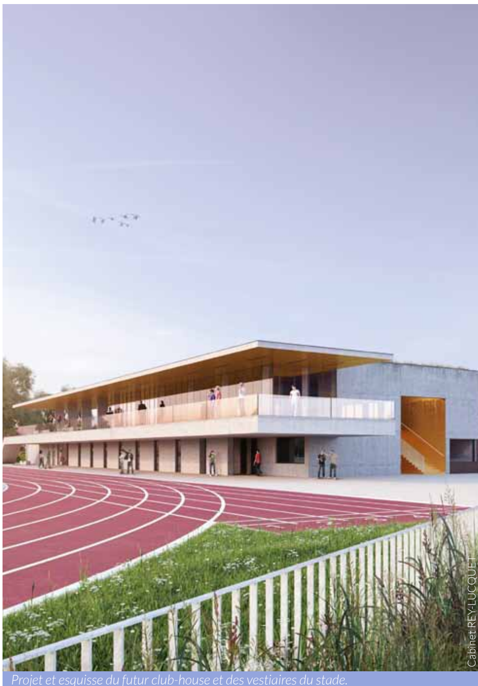
Projet et esquisse du futur club-house et des vestiaires du stade.

L'opération, évaluée à 1 850 000 euros HT, comprend par conséquent la construction en rez-de-chaussée de vestiaires (820 m 2 ) composés de locaux arbitres, de locaux joueurs et locaux divers (infirmerie, rangements). A l'étage, on retrouve un club-house destiné aux clubs de football et d'athlétisme, comprenant des locaux communs mais aussi des espaces propres à chaque association (380 m 2 ). L'enveloppe inclut également la création de locaux techniques, de sanitaires extérieurs, d'un espace de vente des billets et d'une buvette extérieure qui sera mise à disposition de nos associations pour diverses manifestations sportives et culturelles en lien avec la place de l'Espace Jean-Claude Klein. En fin de chantier, il est prévu la déconstruction des vestiaires et du club-house existants ainsi que l'aménagement des circulations autour des nouveaux équipements et à proximité directe du stade.