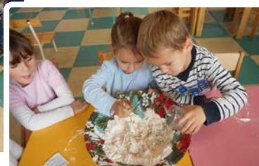
École Maternelle Centre