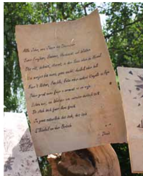
Poème alsacien, par D. Vix