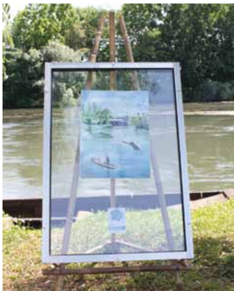
Oeuvre de J. Ehrhard