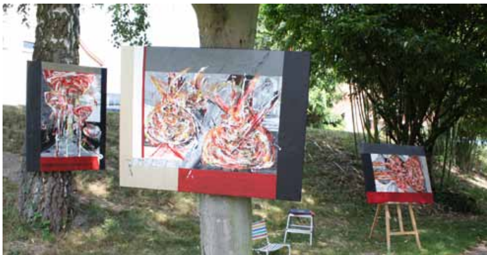
L'art c'est ressentir des choses différentes selon l'angle observé. Tableaux de C. Letrange