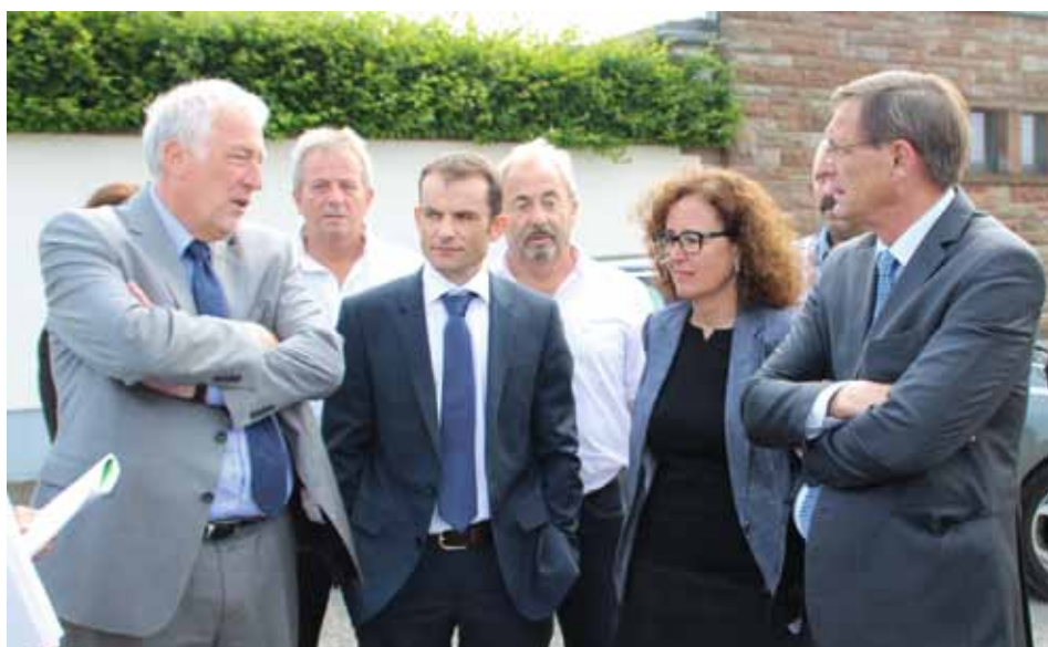
Visite du site du Schwemmloch