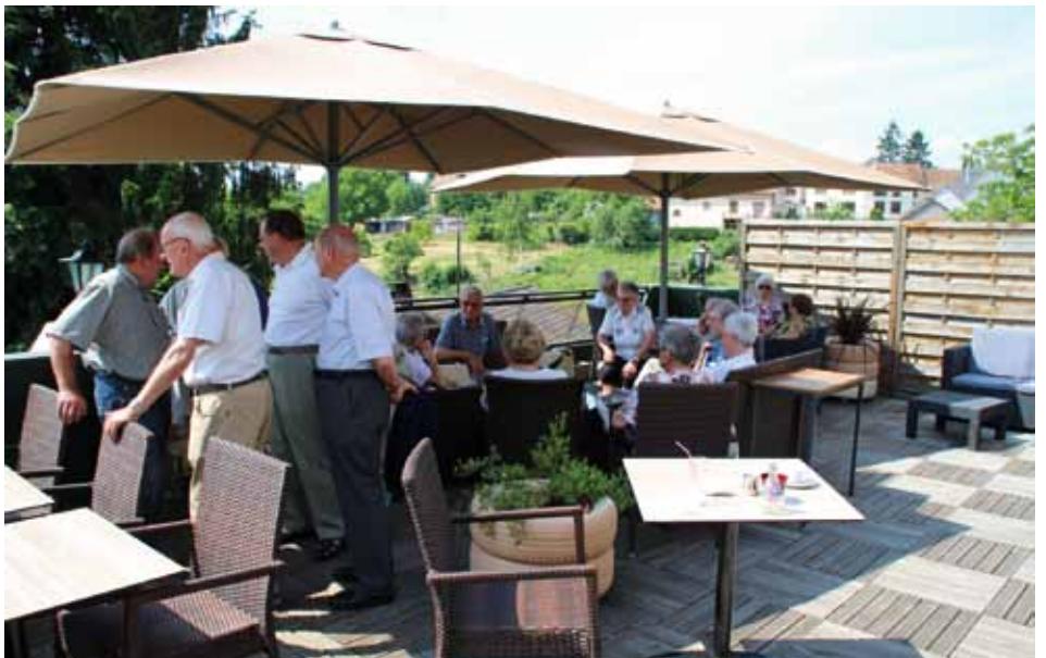
Moments de détente sur la terrasse du restaurant à La Petite Pierre