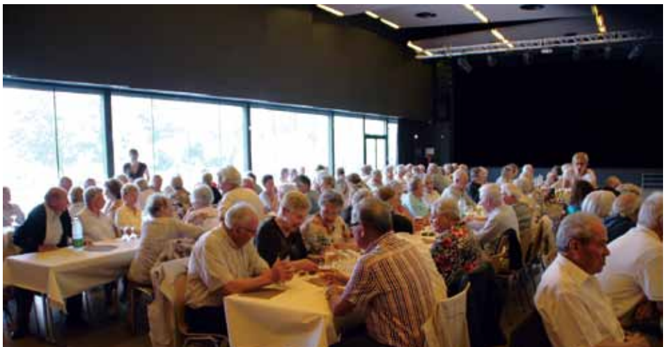
Fin de journée au Fil d'Eau