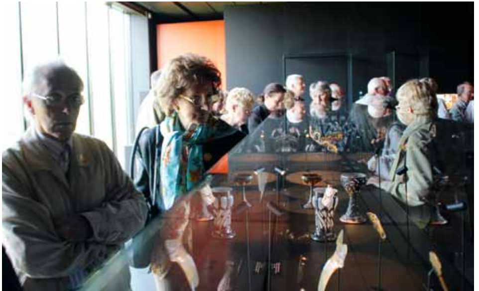
Visite guidée du Musée Lalique