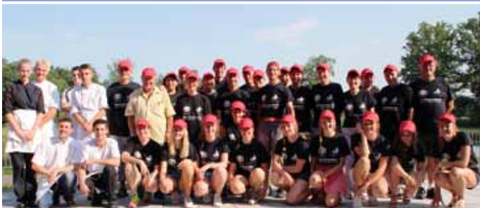
La dynamique équipe de bénévoles (04/07)