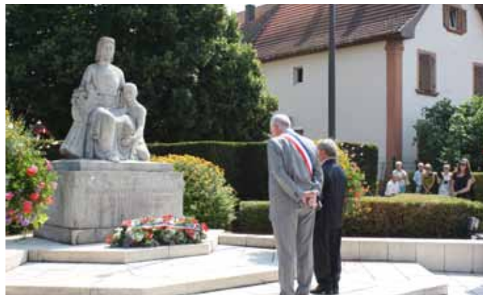
Dépôt de gerbe au Monuments aux Morts (05/07)

Une rencontre jumelage ne se conçoit que par l'implication de tous au sein de nos communes. L'impulsion provient certes des édiles mais la pérennité et la vitalité des échanges reviennent à leurs habitants.