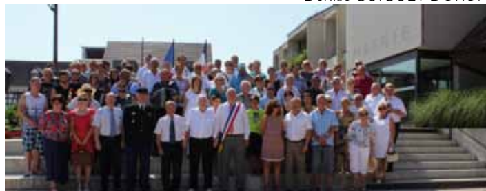
Photo de groupe (05/07)