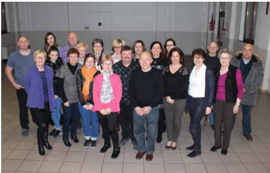
La troupe du théâtre alsacien lors de la remise de chèque à « Un Sourire pour la Vie »

Contact : Un Sourire pour la Vie - 18, rue de Barr - 67460 Souffelweyersheim