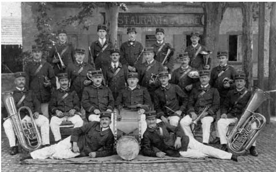
L'Association Musicale de La Wantzenau, dans les années 1930