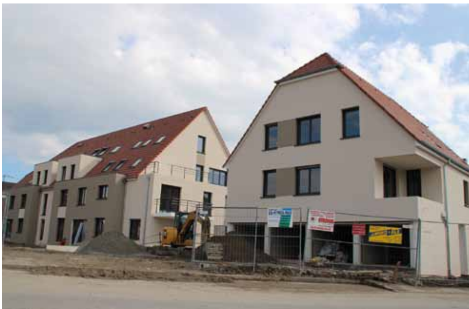
Constructions, rue de la Gare, qui accueilleront, entre autres, des logements sociaux

Malheureusement, ce projet de développement urbain est freiné par l'Etat à cause du futur PGRI (Plan de Gestion des Risques d'Inondation) et des risques d'inondation qui impactent lourdement La Wantzenau. Il en va de même pour le projet du Trissematt.